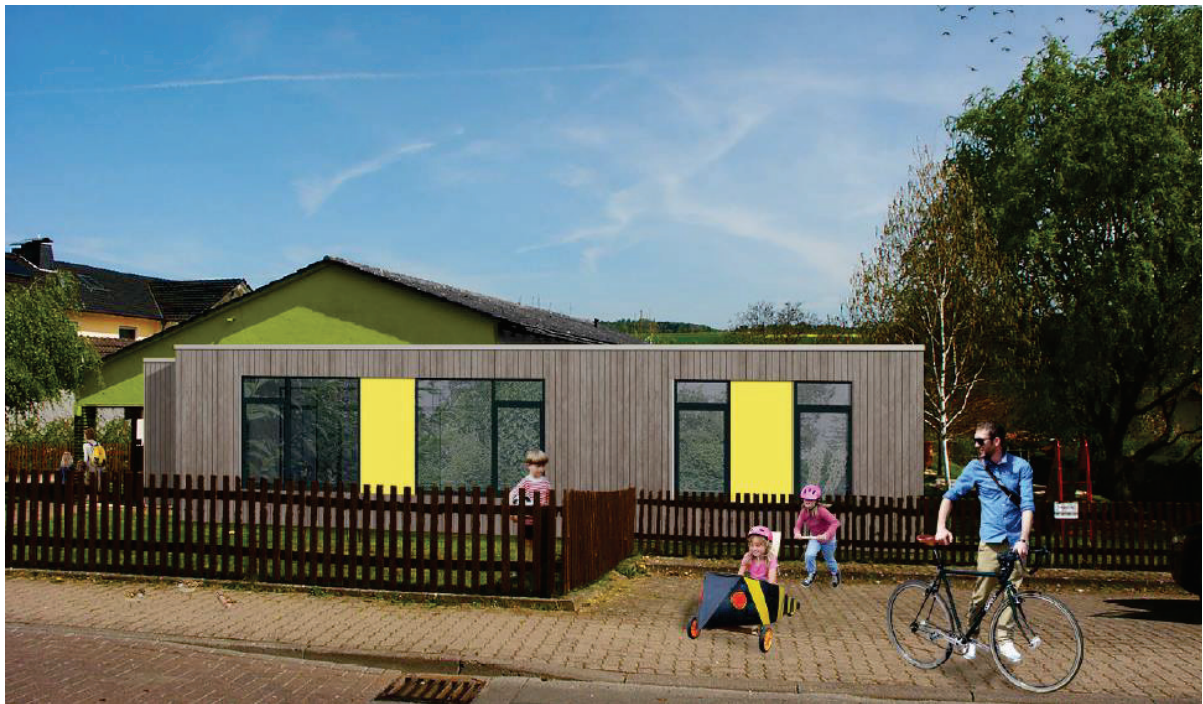
Baumaßnahme Kindergarten Hümme